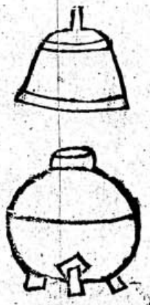
虞氏之敦無飾 後世飾以金玉

敦 鄭氏曰士喪禮敦啓會面足鄭氏曰面足執之令足間鄉 前即敦足非如舊圖然也近代有得敦於地中亦三尺