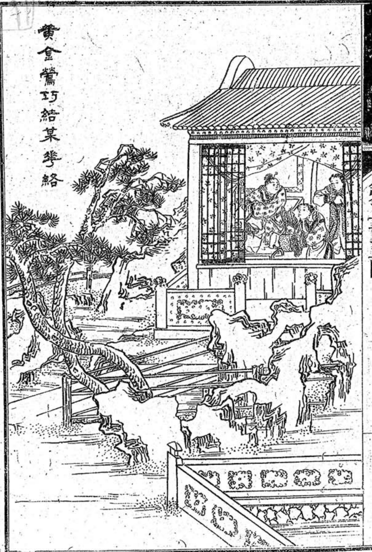
黃金鶯巧結某等絡